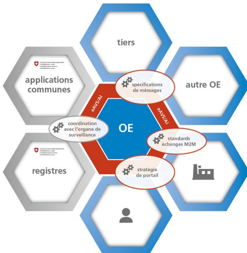
Illustration 1 – Rôle et activités - Stratégie eAVS/AI